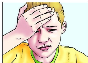
Schwere, quälende Kopfschmerzen