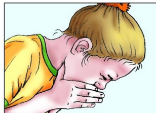
Übelkeit und Erbrechen

Symptome einer durch Meningokokken-C-Bakterien hervorgerufenen Hirnhautentzündung bei Jugendlichen und Erwachsenen. Im konkreten Falle können diese sehr diffus auftreten oder auch nur einzelne Symptome. Beim Auftreten der Symptomatik sofort den Arzt aufsuchen! Vor einer Infektion schützt nur die vorbeugende, von der Ständigen Impfkommission empfohlene Impfung.