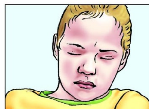
Benommenheit, Verwirrtheit, Apathie