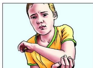
Gelenk und Muskelschmerzen