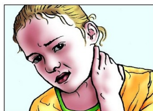
Steifes, starres Genick