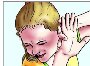
Abneigung gegen helles Licht